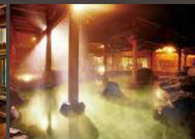
華鳳 回遊露天風呂「大岩露天風呂」