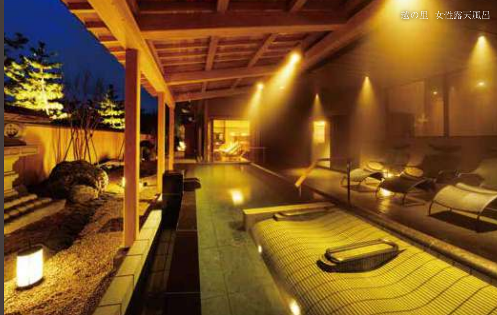
越の里 女性露天風呂