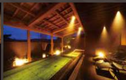
越の里 男性露天風呂