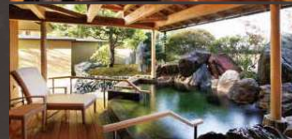
プライベートスパ「月の舟」「星の舟」