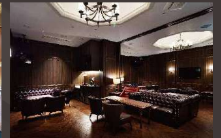
エグゼクティブラウンジ