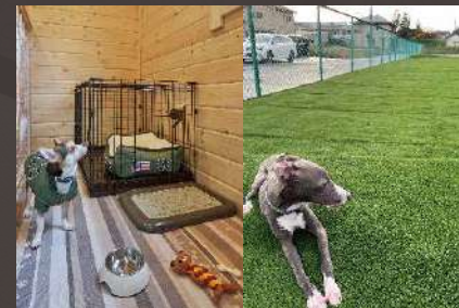
ワンワンハウス&ドッグラン