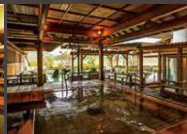
華鳳 回遊露天風呂「能舞台 風呂」