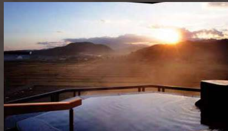
客室展望露天風呂